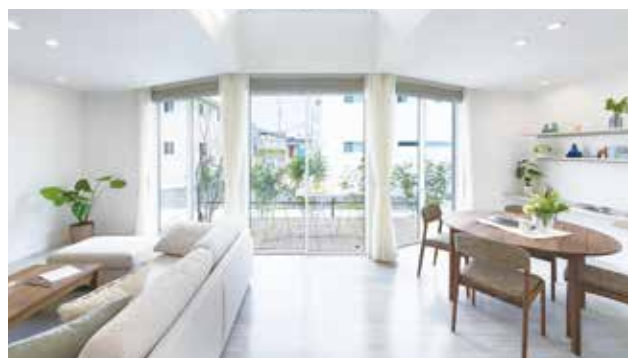
※写真はイメージです。実際の建物とは異なります。